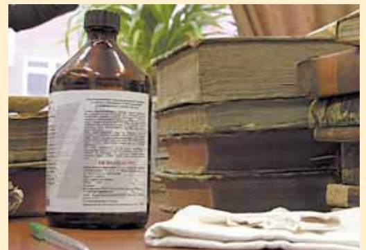
Ученые Пермского университета разработали мощный дезинфектант.