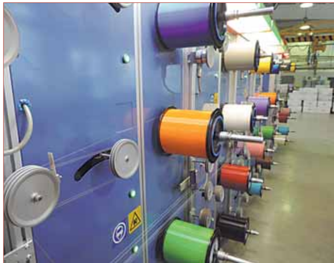
В цехах по производству оптического кабеля — как на швейной фабрике, кругом катушки с «цветными нитками»

Завод «Инкаб» входит в инновационный кластер «Фотоника». Кроме того, проект «Создание производства оптического кабеля, встроенного в грозотрос» стал победителем конкурса комплексных инвестиционных проектов по приоритетным направлениям гражданской промышленности Минпромторга РФ. Размер субсидий, которые может получить «Инкаб» в ходе реализации проекта, превышает 100 млн руб.