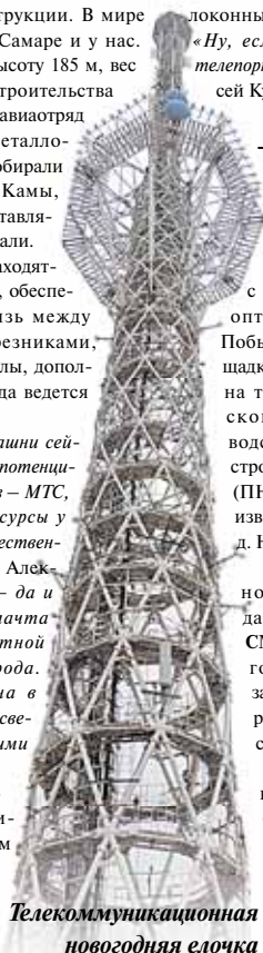
Телекоммуникационная новогодняя елочка

Познакомились журналисты и с участком «Интеллектуальной платформы», с