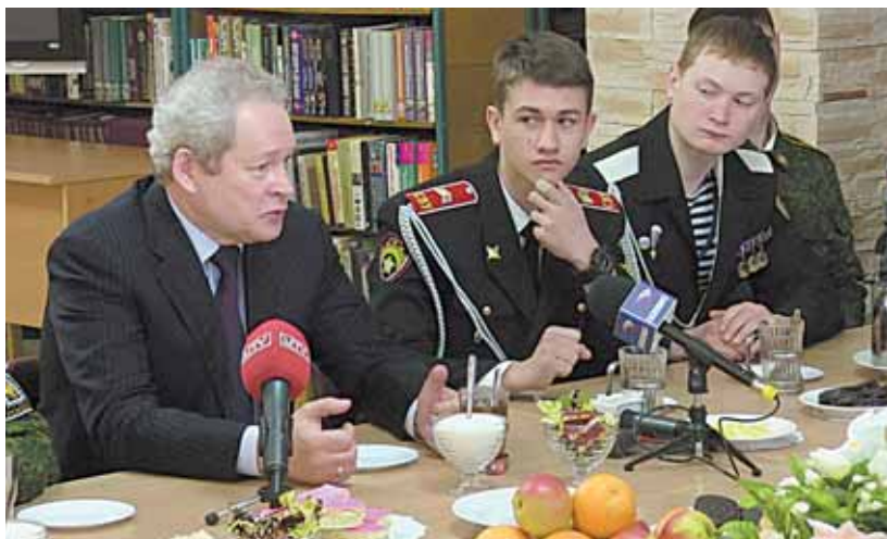
«Не бойтесь трудностей, и правильного вам выбора в жизни!» — пожелал участникам слета Виктор Басаргин

питанию чувства патриотизма, тот огромный труд, которым занимаются наши кадетские и суворовские училища. Испытываю гордость за то, что в Пермском крае есть центр такой работы — наш кадетский корпус», — сказал Виктор Басаргин.