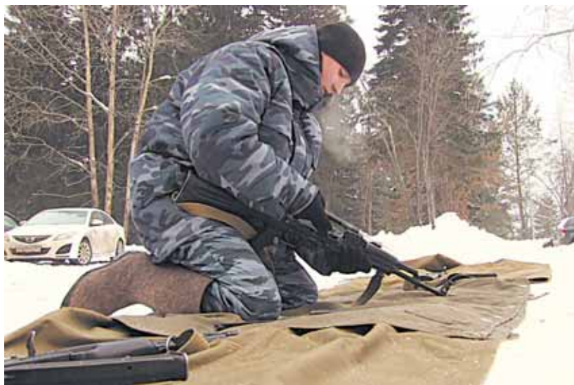
Сборка и разборка автомата

«С чего начинается Родина?..» Кадеты точно знают — с преданности своей стране, с любви к ней, с готовности защищать и работать ради ее процветания.