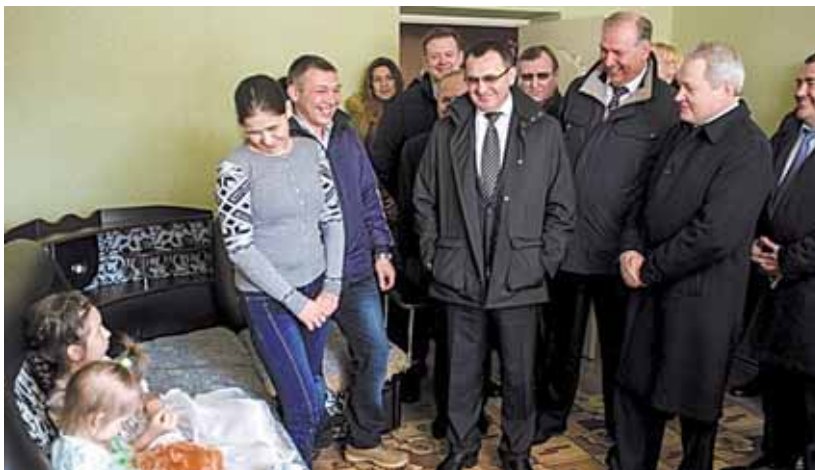
Николай Федоров и Виктор Басаргин побывали в гостях у семьи Вахриных, которая получила дом от птицефабрики

правительства и главами муниципальных районов министр провел совещание по развитию малых форм хозяйствования на селе и устойчивому развитию территорий. Село Фоки и птицефабрика «Чайковская» стали примером такого развития, способствующего устойчивому росту агроэкономики. Это было отмечено на совещании, открывая которое министр отметил: