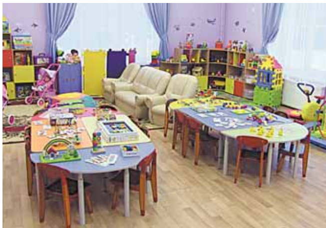
Жизнь и здоровье детей под надежной защитой

– Мы недавно заключили договор с «Альфой», но что сразу заметно – это профессионализм компании и ее сотрудников. Услуги, которые предлагает организация, уникальны. Таких нет у других предприятий. Например, наблюдение за учреждением и территорией онлайн. Родители детей просто в восторге от подобного уровня безопасности. Учитывая современные требования, родителям такая услуга необходима, вернее, целый комплекс услуг, что, конечно, привлекает и доказывает серьезный подход