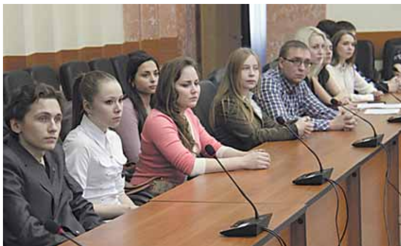
Повышение имиджа профессии предпринимателя — государственная задача...

В прошлом году Владимир Путин одобрил проект «История российского предпринимательства». В этом году Пермский край открыл цикл мероприятий, посвященных возвращению доброго имени отечественного бизнесмена.