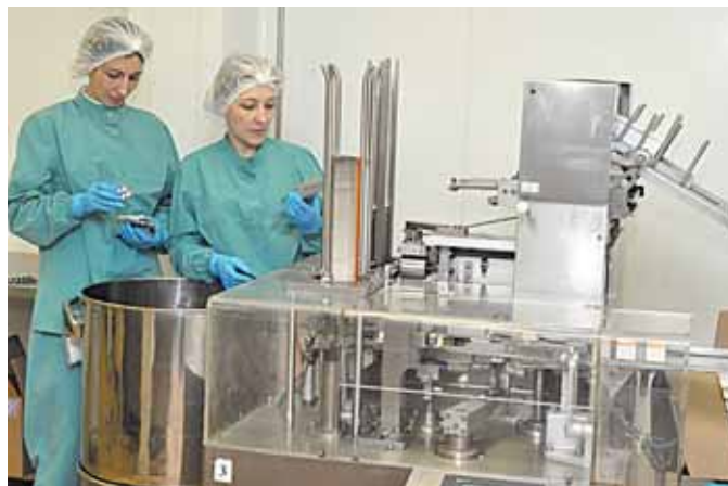
Предприятия фармакологического рынка смогут получить государственную поддержку

Несмотря на рост цен, бесплатная помощь будет увеличиваться. Соответ-