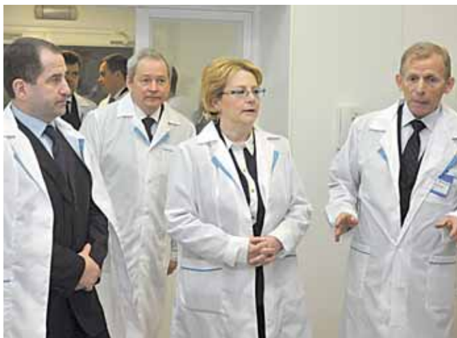
Уже сейчас в разных региональных медцентрах внедрены самые передовые методы лечения и профилактики заболеваний сердца, — отметила Вероника Скворцова

— Все эти тридцать предприятий являются базовыми площадками для развертывания дополнительных производств новых лекарственных препаратов, — заключил Михаил Бабич. — В том числе благодаря этим предприятиям мы сможем выполнить задачу по разработке технологий для импортозамещения, произ-