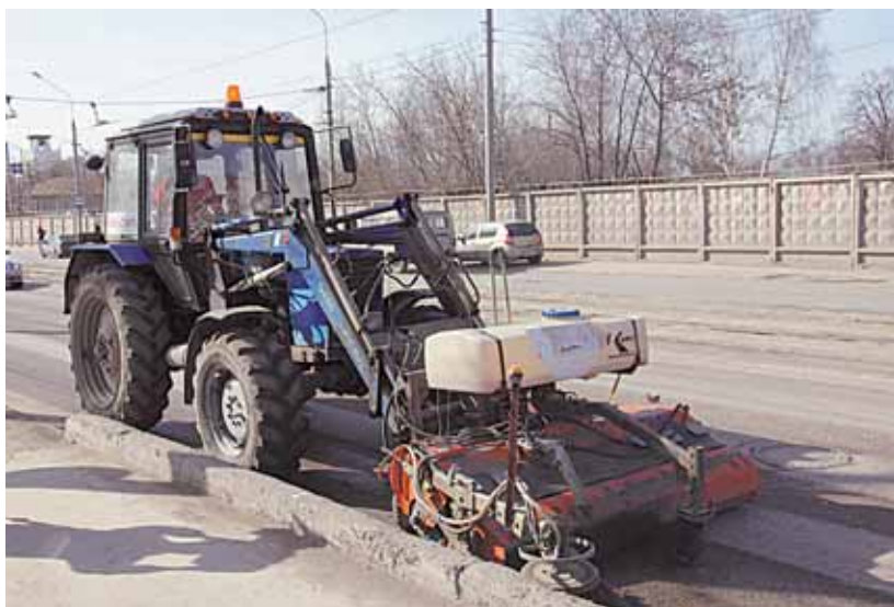
В Мотовилихе постарались полностью убрать оттаявший мусор

сообщать на сервис «Решаем вместе» (сайт администрации Перми www.gorodperm.ru ). Этот ресурс создан для того, чтобы пермяки могли контролировать своевре-