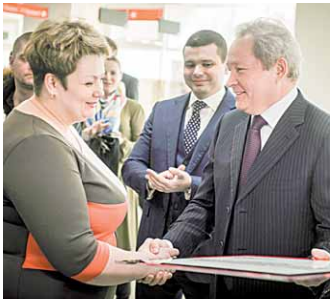
Губернатор Прикамья поздравил коллектив центрального офиса МФЦ и вручил памятную награду

На сегодня в Пермском крае открыто 32 МФЦ, предоставляющих государственные и муниципальные услуги по принципу «одного окна». К концу года их должно стать 59.