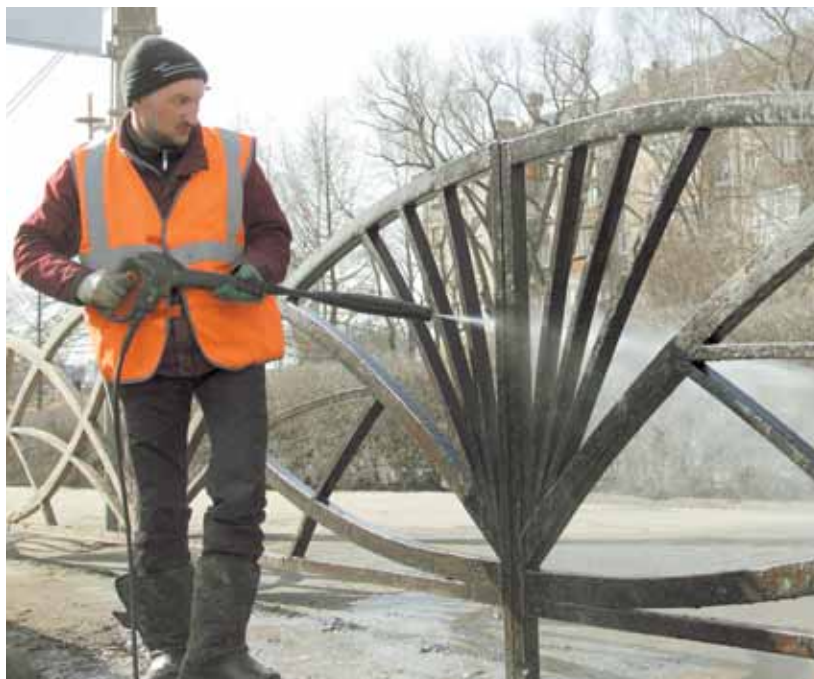
Ограждения на Северной дамбе стали чище