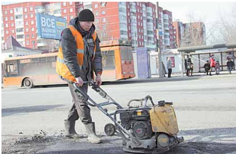
Проведен ямочный ремонт по проспекту Парковому

Кульминацией городской уборки станет традиционный субботник 25 апреля. В нем могут принять участие все желающие.