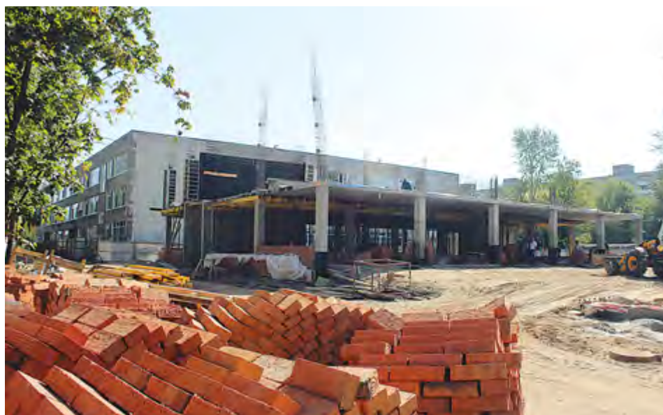
Около школы № 32 идет строительство нового спортивного зала

Представители комиссии проверили учреждения сразу по нескольким направ-