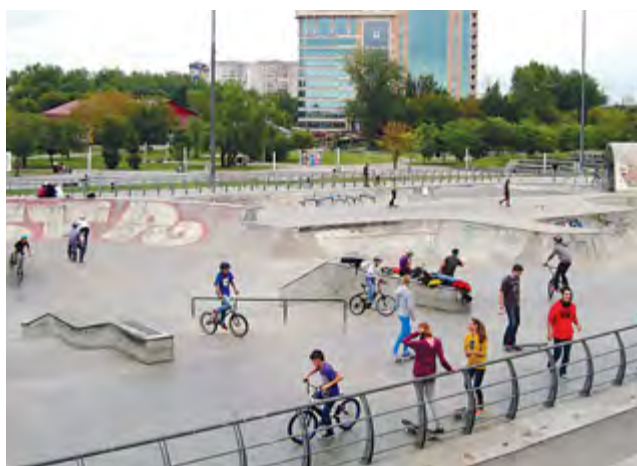
В 2016-м отремонтируют бетонную чашу экстрим-парка