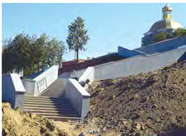
Очередные работы на набережной в стадии завершения

— Я родилась в Перми и очень люблю ее. Есть ли какие-то негативные проблемы, я, честно говоря, не замечаю. Мне в краевой столице всё очень нравится.