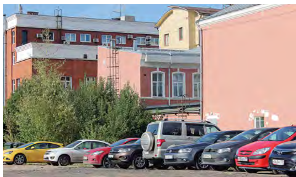
Из-за участка земли около гимназии № 17 до сих пор идет спор хозяйствующих субъектов

лениям: обеспечение пожарной и антитеррористической безопасности, выполнение санитарных, гигиенических и медицинских мероприятий, проведение ремонта в соответствии с нормативными требованиями.