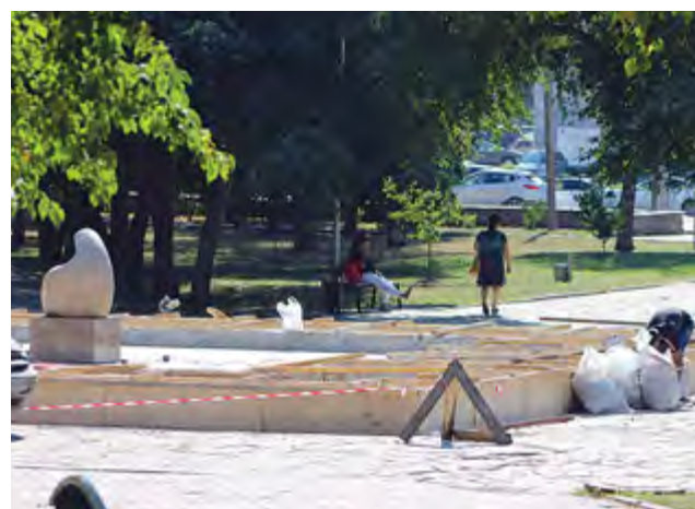
В сквере Уральских добровольцев начался ремонт фонтана