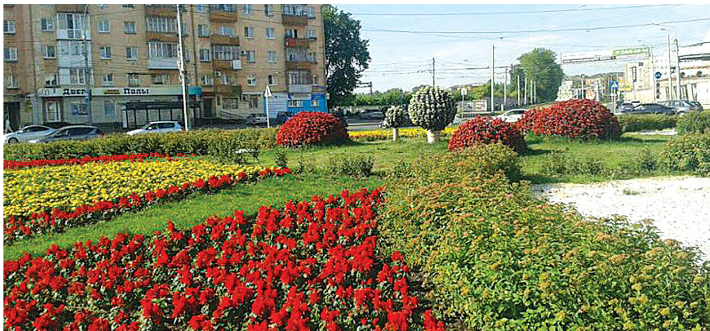
В этом году в Перми был высажен 1 млн цветов

Там, где физически невозможно посадить крупные растения, используются подвесные кашпо или специальные конструкции. Подобные способы озеленения можно наблюдать на перекрестке ул. Островского и Южной дамбы, на площади Карла Маркса.