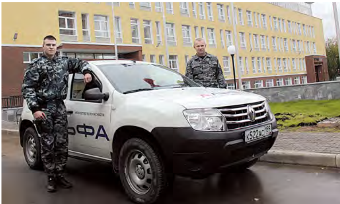
ГК «Альфа» надежно охраняет десятки образовательных учреждений Перми

На этот случай есть прекрасный выход – Группа компаний «Альфа» тесно сотрудничает со многими образовательными учреждениями, в том числе дошкольного и дополнительного образования. Обеспечение безопасности детей – одно из наиболее важных и развиваемых направлений ГК «Альфа». Можно сказать, к 1 сентября «Альфа» мобилизует все свои силы для обеспечения безопасности наших детей.