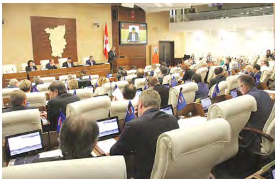
После выборов 18 сентября депутаты Заксобрания передадут эстафету новому созыву

Необходимо отметить, что минувшую пятилетку Пермский край начинал с профицитом бюджета и даже с экономической «подушкой безопасности». На сегодня бюджет Прикамья практически предельно дефицитный. Бесспорно, на это повлияла и экономическая ситуация в стране в