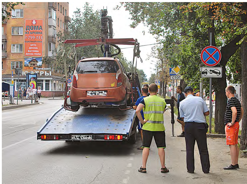
До 1 октября штрафы за несвоевременную оплату парковок брать не будут

Пермское УФАС России начало проверку действий Пермской дирекции дорожного движения (ПДДД) и победителя аукциона по обустройству платных парковок — ООО «Ростелеком» на наличие признаков ущемления интересов неопределенного круга лиц.