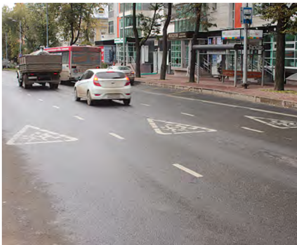
На дорожном полотне появилась разметка, дублирующая знак «Дети»

Большинство директоров школ, учителей, заведующих детскими садами, родителей удовлетворены той работой, которая