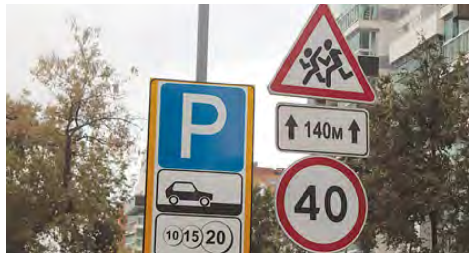
Такой набор знаков должен появиться у каждого детского учреждения