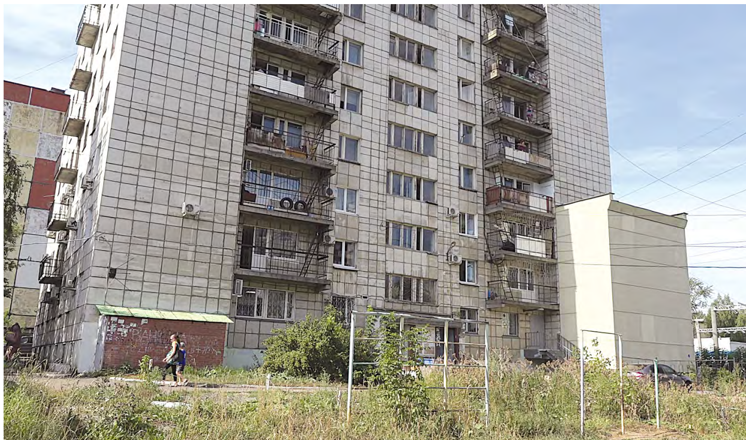
Ул. Народовольческая, 42: за 6 лет маневренный фонд для переселенцев стал почти родным домом

— Обидно, что в момент подписания договоров с «КамИнвестСтроем» администрация была в курсе ситуации, но всё равно дала добро на совершение сделок, — говорит Любовь Тепелина. — Конечно, мы все были тогда в эйфории. Компенсация за старую квартиру составила 1 млн 350 тыс., и я на радостях решила приобрести двухкомнатную, взяв недостающую сумму по ипотеке. И вот уже год плачу по 18,5 тыс. руб. в месяц. За воздух.