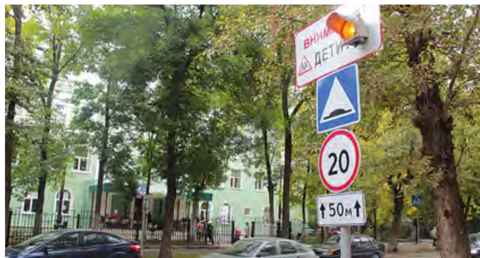
Дорожные знаки и разметка соответствуют ГОСТу

Помимо этого, с 1 сентября в учреждениях школьного и дошкольного образования проводятся линейки и занятия на тему безопасности на дорогах с участием инспекторов ГАИ.