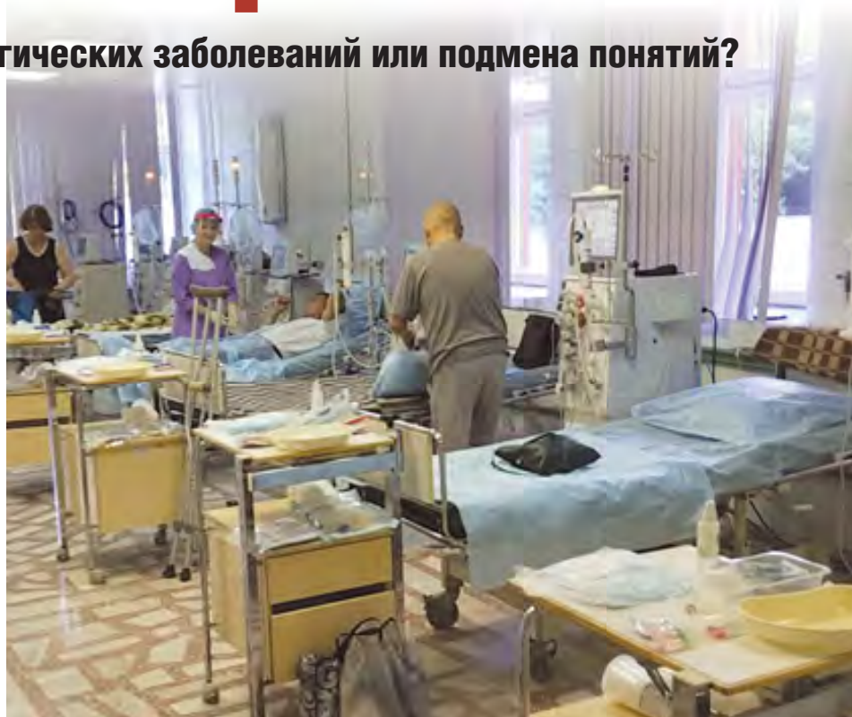
Процедура диализа в центре на ул. Яблочкова проводится ежедневно в четыре смены