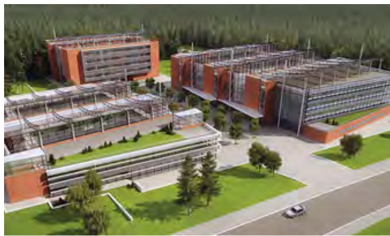
Такой могла быть школа Сколково в Перми — выигравший проект компании ARUP в 2012 году

Концепция образовательного комплекса, представленная коллективом разработчиков из Лицея № 10 Перми, вошла в число лауреатов и была рекомендована Фондом «Сколково» к исполнению. Проект предполагает создание инновационного образовательного центра, где будут получать образование дети, в том числе с ограниченными возможностями здоровья, проявляющие особые способности в науке, творчестве и спорте. Предполагается, что комплекс объединит детей 3–18 лет, именно поэтому основными зданиями станут школа и детский сад. Здания предполагаются нетиповые, с большим количеством лабораторий и мест для исследовательской и проектной деятельности. Внутренние помещения планируется сделать такими, чтобы каждую аудиторию можно было превратить в компьютерный класс, лабораторию или лекторскую. Для проявляющих особые способности в спорте будет предусмотрен спорткомплекс.