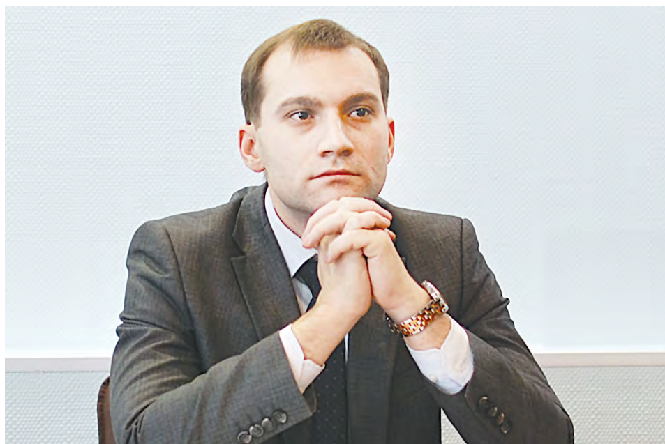
УФАС в очередной раз предостерегает участников рынка от незаконных действий и ограничения конкуренции

Как пояснил начальник отдела правового обеспечения ОАО «МРСК Урала»