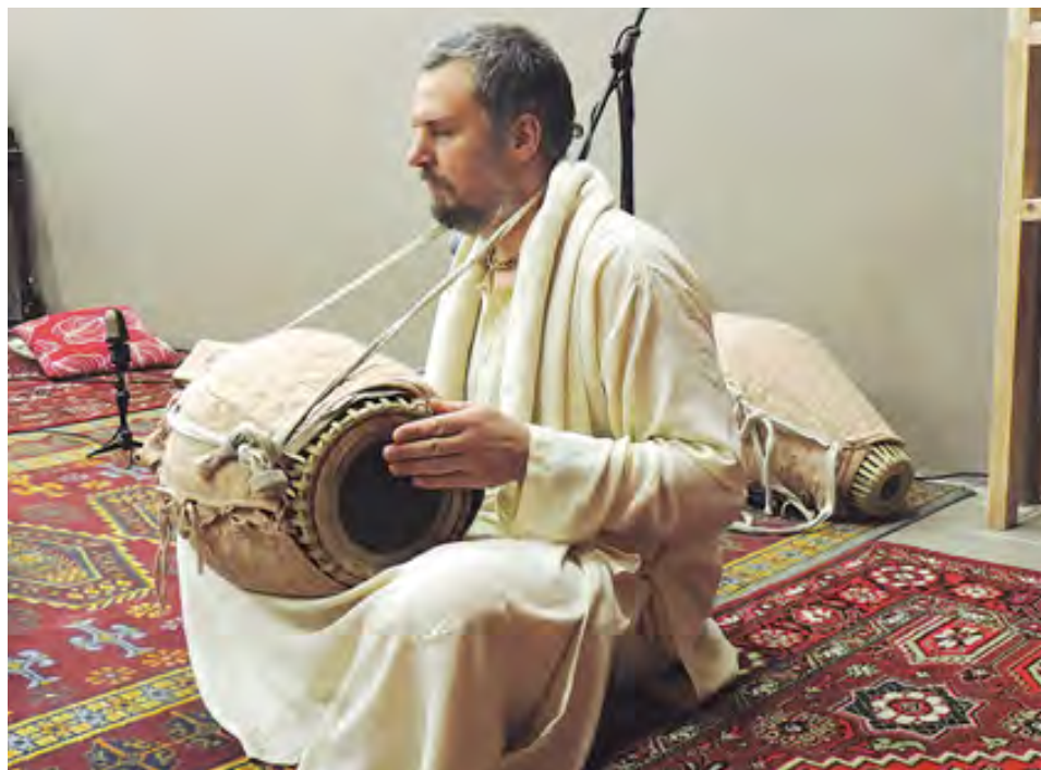
Барaban-мриданга способен издавать звуки бесчисленных оттенков и сложных ритмов