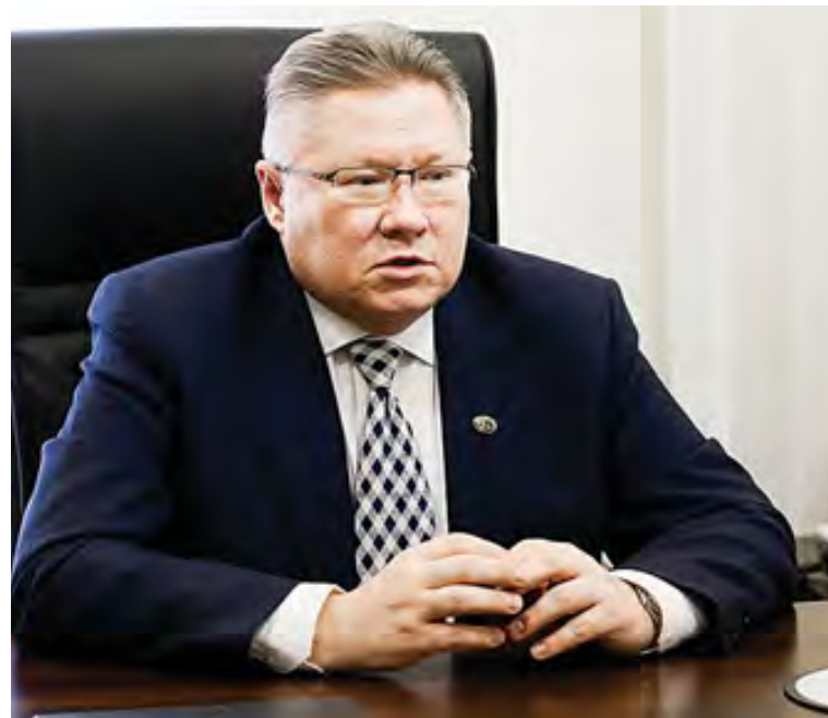
Вячеслав Белов: «Рост жалоб оцениваю положительно»

По словам бизнес-омбудсмена, размеры административных