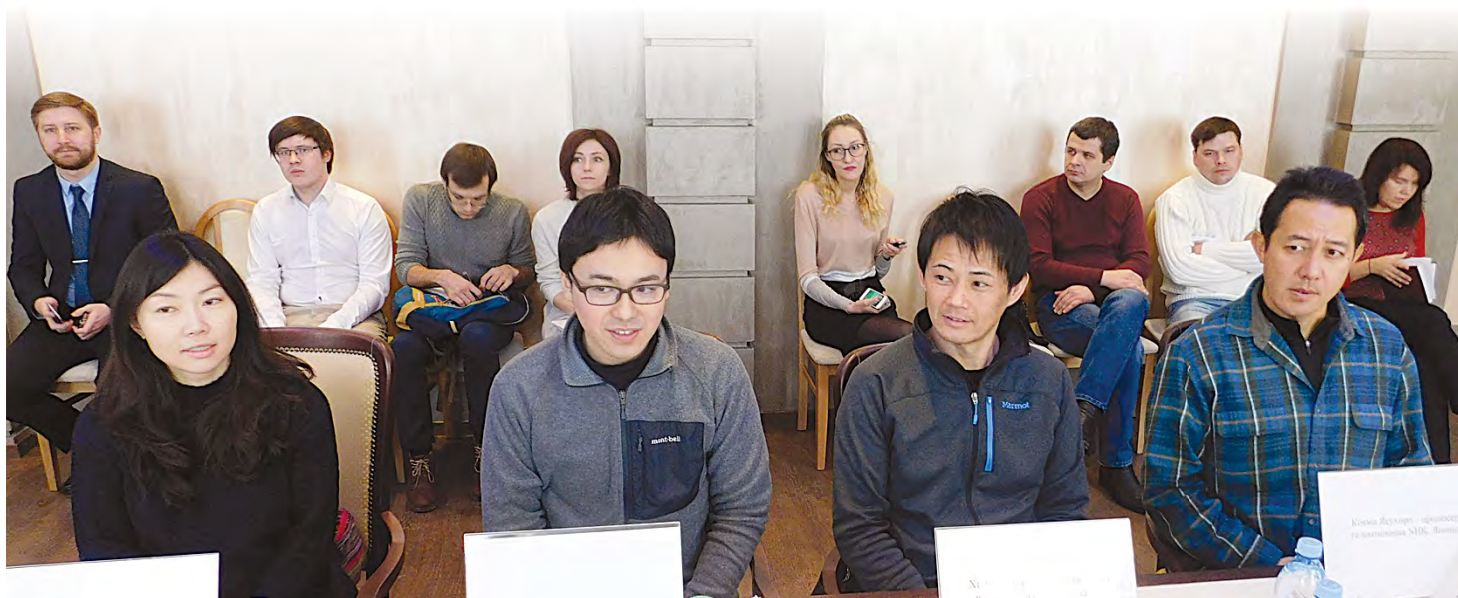
Четыре японских оператора-дайвера сняли уникальный «подводный» фильм об Ординской пещере

– Я работала на Олимпиаде в Сочи. Услышала от СМИ об Ординской пещере. Потом на сайте посмотрела красивые фотки. Захотела попасть туда, – продолжает тему, причем по-русски, «виновница»