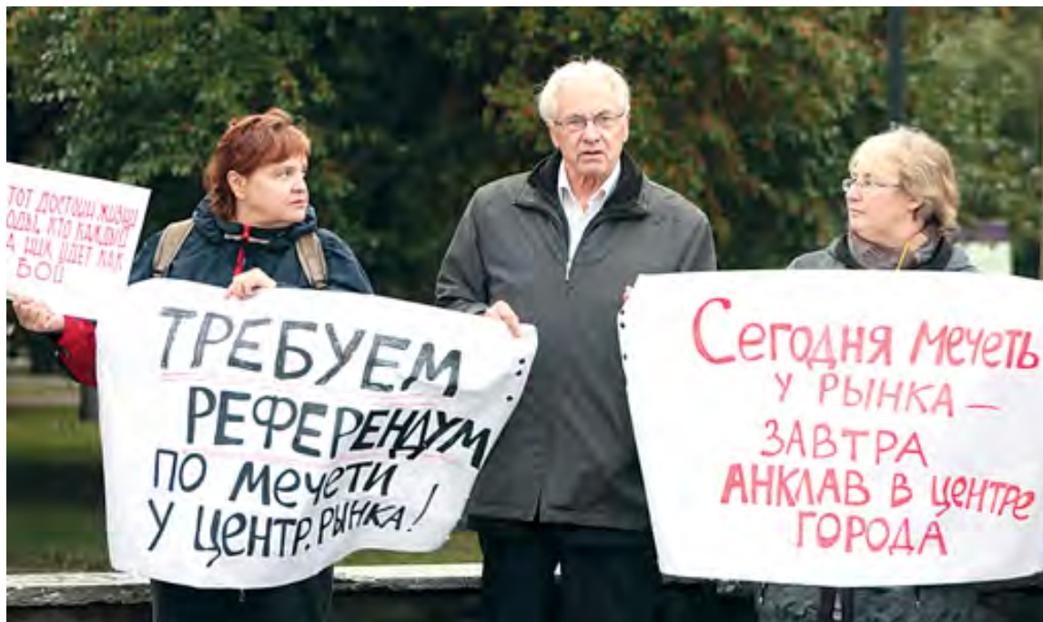
Противники строительства мечети на ул. Крылова демонстрировали «народный гнев»

В ответ противники возведения еврейского центра занялись, так сказать, публичным троллингом как самой общины, так и отдельных ее представителей, не оставляя без внимания и краевых