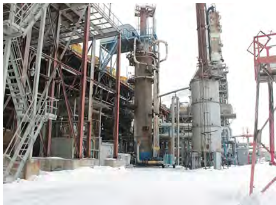
Здесь из газовой смеси синтезируется аммиак. Колонна синтеза аммиака выдает теперь 92 т готового продукта в сутки

лет будем им заниматься. Проект включает в себя строительство второй башни приллирования, значительную модернизацию практически всех узлов в составе цеха карбамида. Общие вложения составят не менее 5 млрд руб. с НДС. Проект по карбамиду более сложный, он предполагает модернизацию основного цеха.