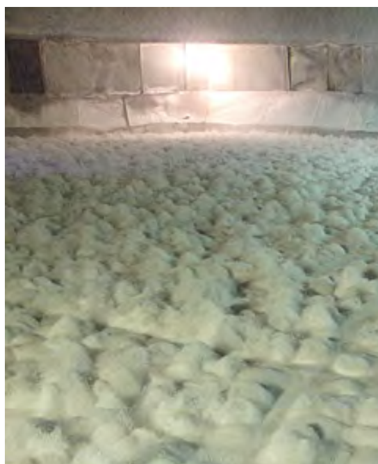
Капли расплавленного карбамида застывают в форме мелких гранул

— Следующий шаг — глубокая модернизация агрегата карбамида, его техническое перевооружение. Этот проект мы считаем стратегическим и следующие несколько