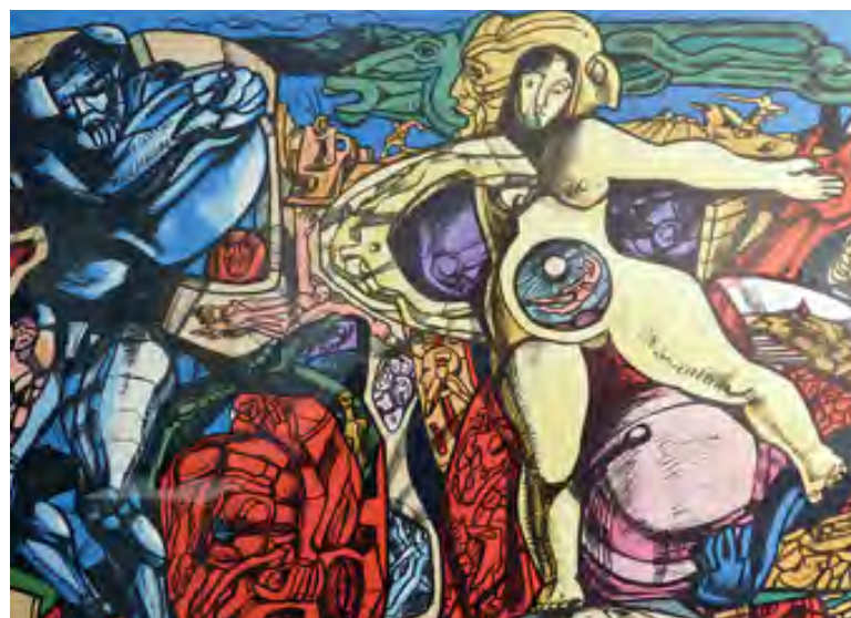
Вся жизнь художника — в его работах