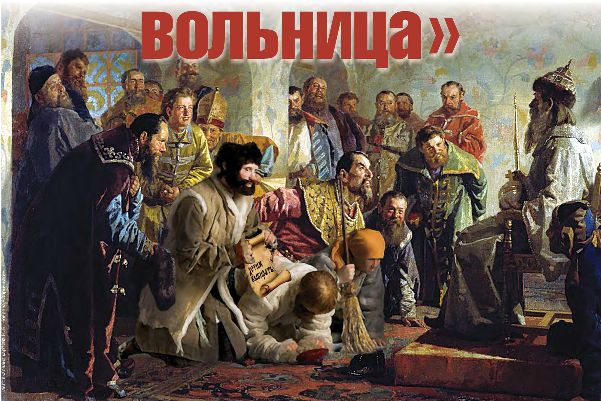
Использована картина Н. В. Неврева «Опричники»